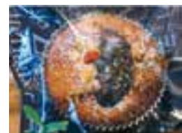
信州みそと森の木の実のパウンドケーキ(ミニ)

【営業日と時間】火曜日～土曜日 11:30～13:30ラストオーダー 【定休日】: 日曜日・月曜日・祭日 【HP】 https://www.npo-tekuteku.jp