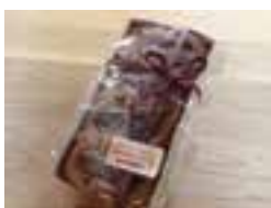
信州みそと森の木の実のパウンドケーキ